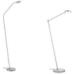
THEA-S-Flex und THEA-S 41.975.xx und 41.980.xx Stehleuchte / floor lamp 10,8 W LED, 2.700 K, 1100 lm