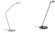
THEA-T-Flex und THEA-T 61.623.xx und 61.626.xx Tischleuchte / table lamp 10,8 W LED, 2.700 K, 1100 lm