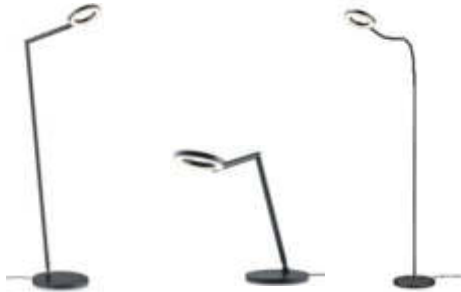
TESSA-S 41.990.xx 17 W LED, 2.200 – 3.500 K, 1.904 lm EEL-F TESSA-T 61.628.xx TESSA-S-Flex 41.991.xx